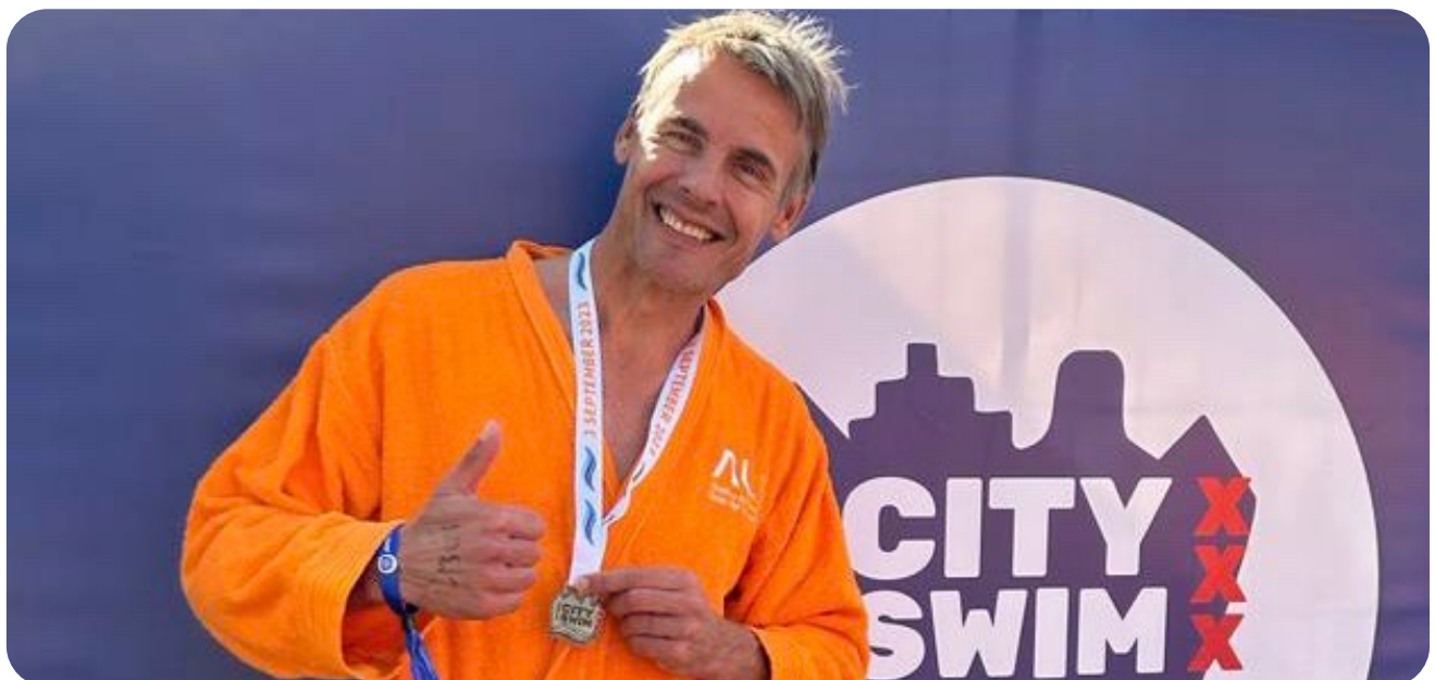
Amsterdam City Swim voor ALS