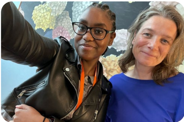
Baas van Morgen