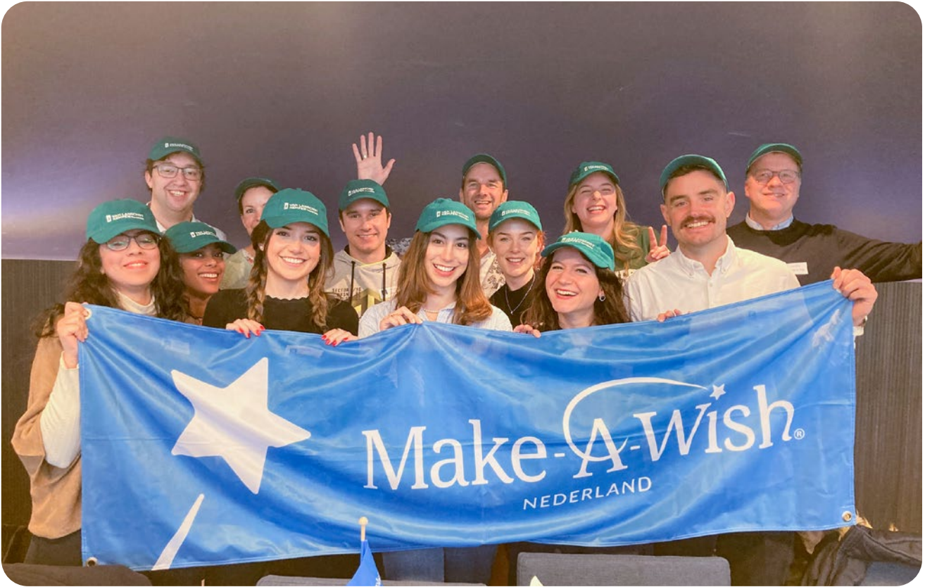
Make-A-Wish Business challenge