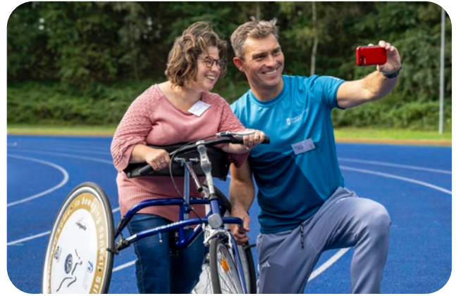
Vereniging De Zonnebloem - Run & Roll