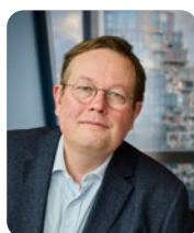
Godfried van Lanschot Voorzitter

Deze solide basis stelt ons in staat om in 2024 met vernieuwde energie onze doelstellingen na te streven en de resultaten van 2023 te overtreffen. We hopen dit jaar nog meer medewerkers bij de Van Lanschot Kempen Foundation te betrekken. Gezien de fantastische inzet van iedereen in 2023 hebben we er alle vertrouwen in dat dit zal lukken.