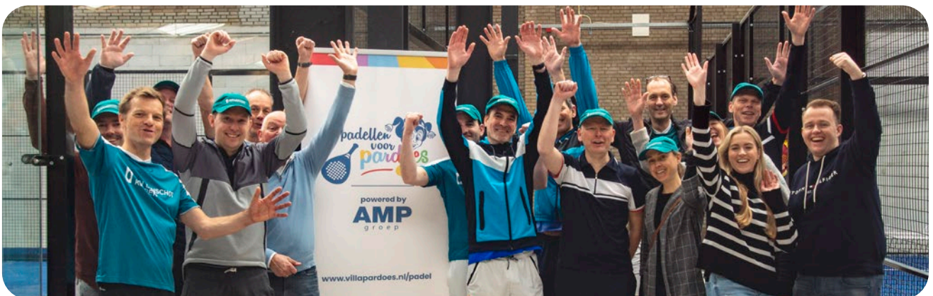
Padel voor Villa Pardoes