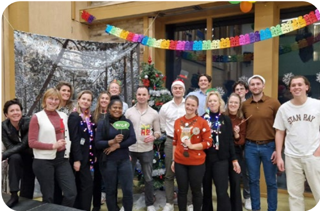
Stichting Eerlijke Start