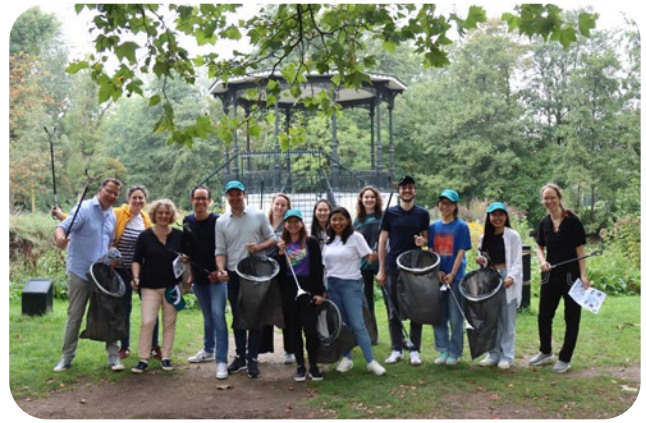
Team up to Clean up - Vondelpark Amsterdam