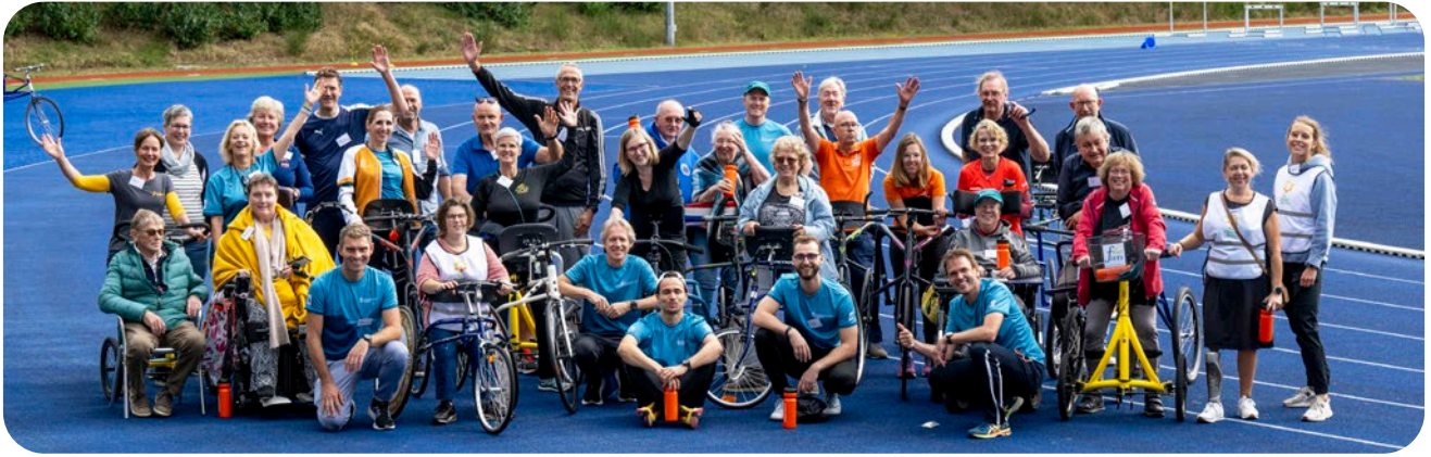
Vereniging De Zonnebloem - Run & Roll