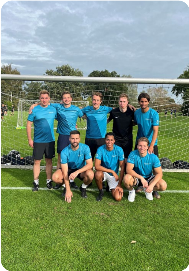
Zuidas Cup voor Stichting Carpe Diem (Esther Fonds)