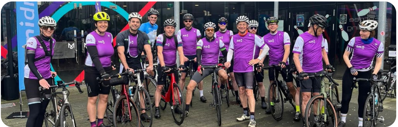
Giro D'Italia - Spieren voor Spieren