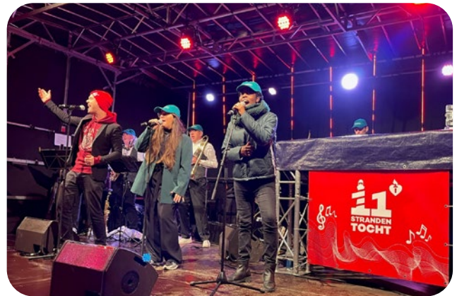
11strandentocht - Van Lanschot Kempen Collective