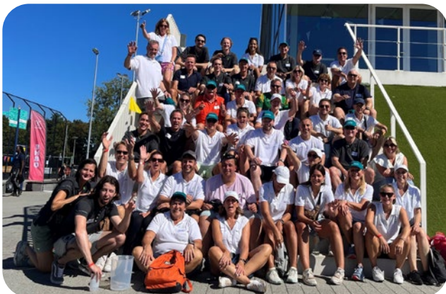
De Spelen Rotterdam