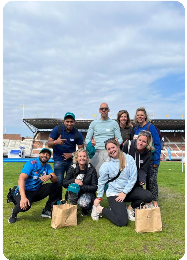
De Spelen Amsterdam