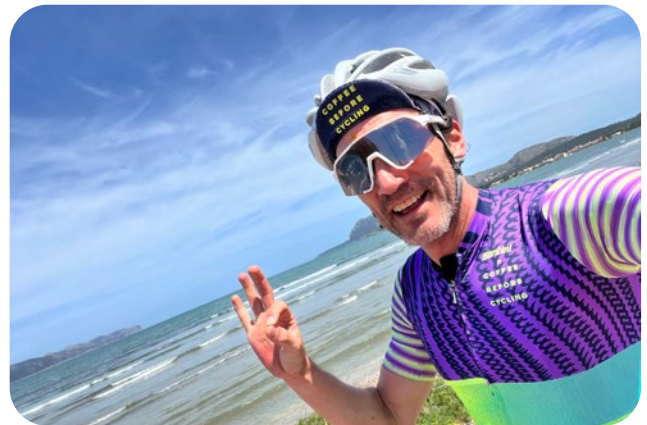
Team Alzheimer challenge