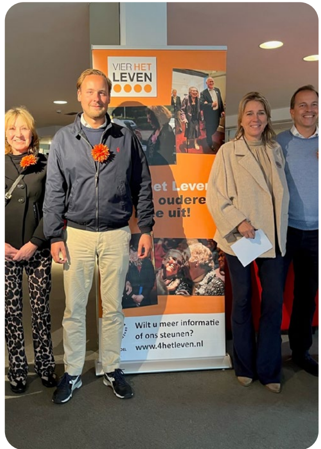
Stichting Vier het Leven