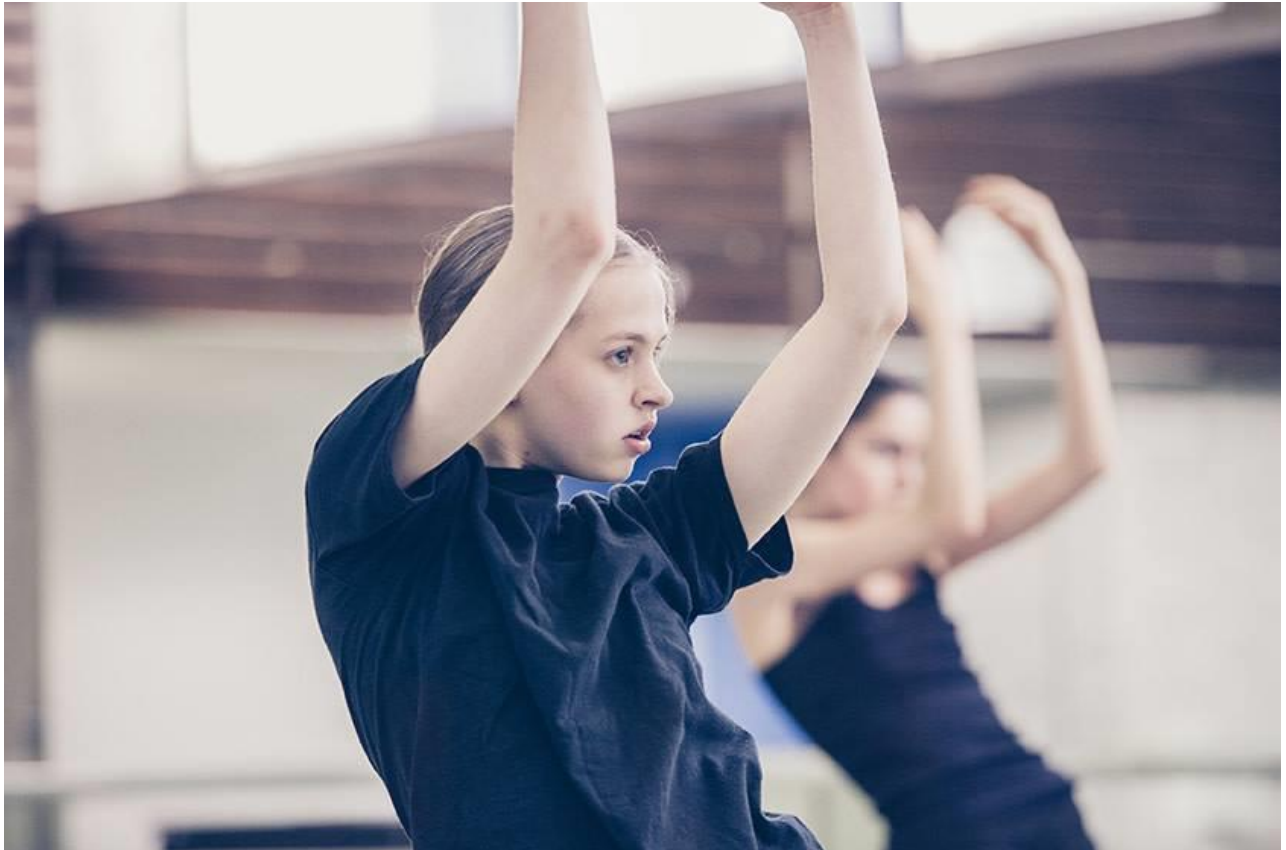
Nederlands Dans Theater – Young Talent Project

In alle gevallen worden de donaties op aanvraag verstrekt.