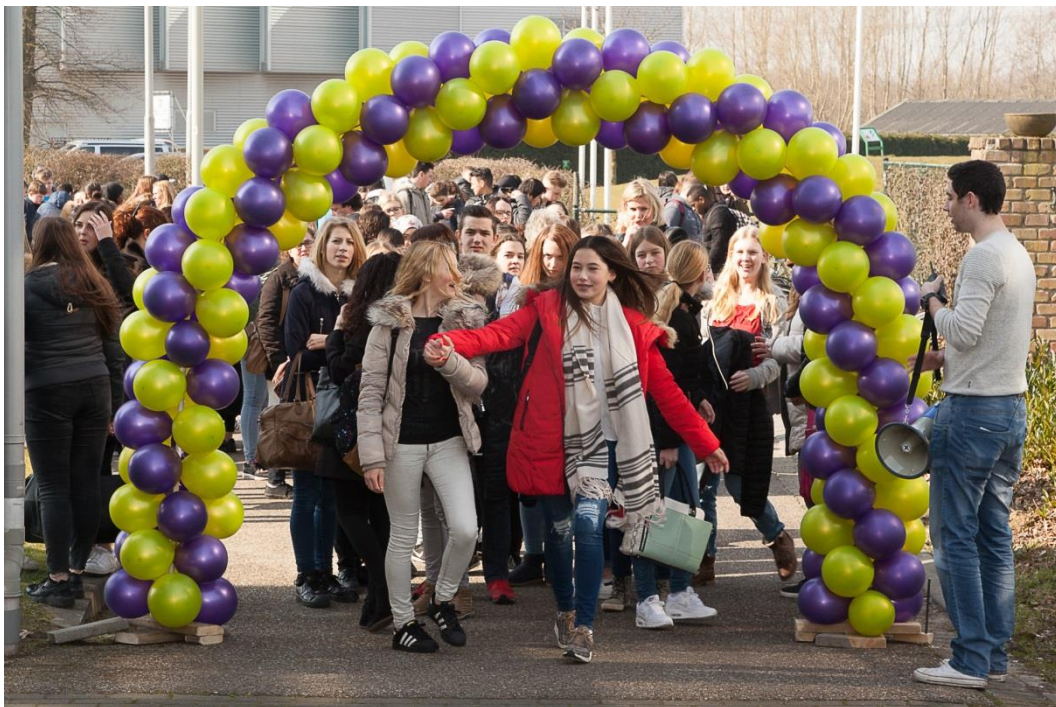
VMBO on Stage - Beroependag

De medewerkers van het bureau ontvangen voor hun werkzaamheden een marktconform salaris.