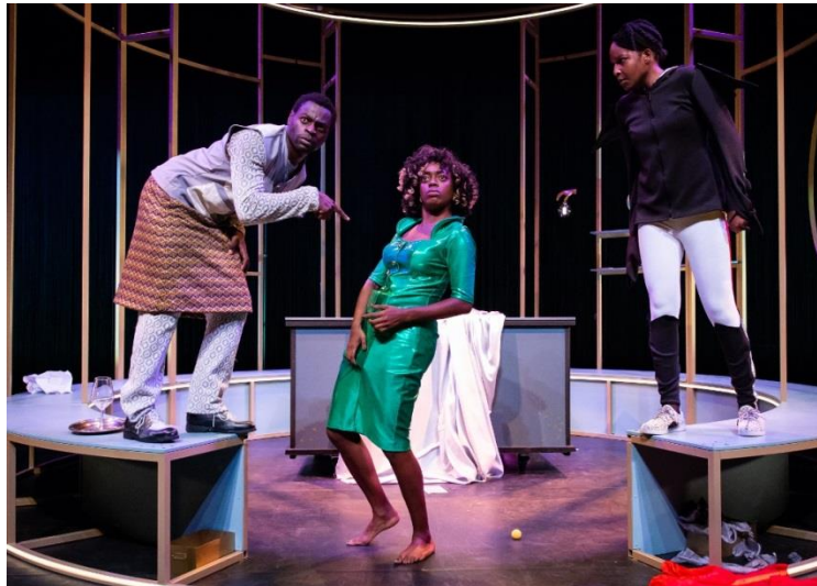
Maas Theater - De Jokebrokker

Donaties van meer dan € 5.000 werden gedaan aan Holland Opera, Kindermuziekweek, SPRING festival, Onder het Buro, STIP, Cement, Delft Fringe Festival, Café Theater festival, Karavaan Exceptionel, MAN|CO, en Nederlands Dans Theater.