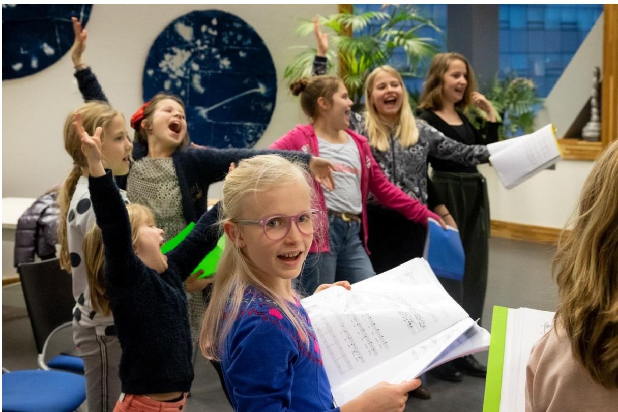
Holland Opera – Muziek Express

De directeur van de stichting bekleedt sinds begin 2018 het voorzitterschap van het LFO en is één van de twee contactpersonen voor de fondsen in het kader van het convenant tussen vermogensfondsen en de Gemeente Amsterdam (2014-2019). De directeur neemt deel aan een collegiaal intervisie-programma met een zestal andere fondsdirecteuren.